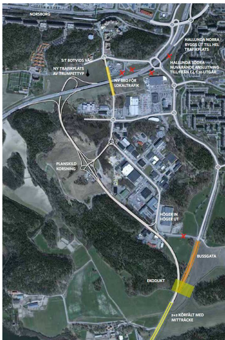
Trafikverkets förslag till ny Hågelbyled, årgång 1971 2011.

Nätverket YIMBY ser mycket positivt på Botkyrka kommuns planer att förtäta och koppla samman Alby och Eriksberg. Att förtäta i redan bebyggda områden är ett bra sätt att ge plats för fler i Stockholmsområdet utan att ta ny orörd natur i anspråk. Att förtäta där det redan finns en utbyggd kollektivtrafik är också en utmärkt strategi för att få fler att välja bort bilen till förmån för kollektivtrafiken. Tyvärr motarbetas kommunens goda intentioner delvis av Trafikverkets förslag till ny Hågelbyled inom så kallade steg 4-åtgärder.